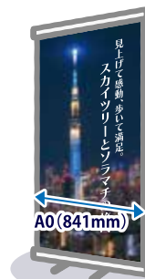
ロールアップ スクリーン