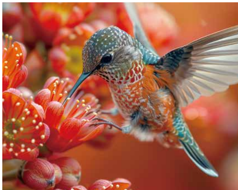
※印刷イメージです