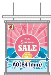
タペストリー・ 吊り下げバナー