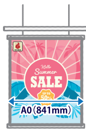
タペストリー・ 吊り下げバナー