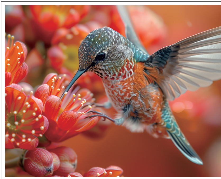
※印刷イメージです