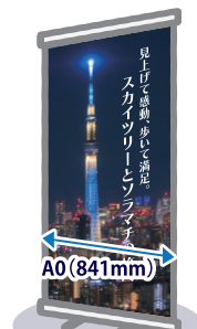
ロールアップ スクリーン