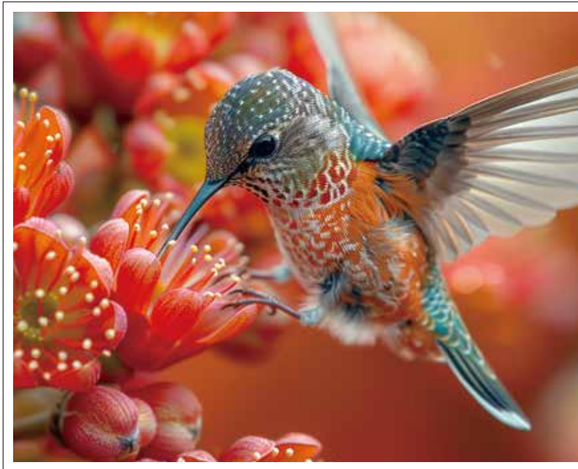
※印刷イメージです