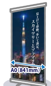
ロールアップ スクリーン