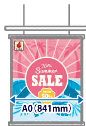
タペストリー・ 吊り下げバナー