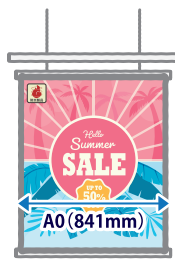
タペストリー・ 吊り下げバナー